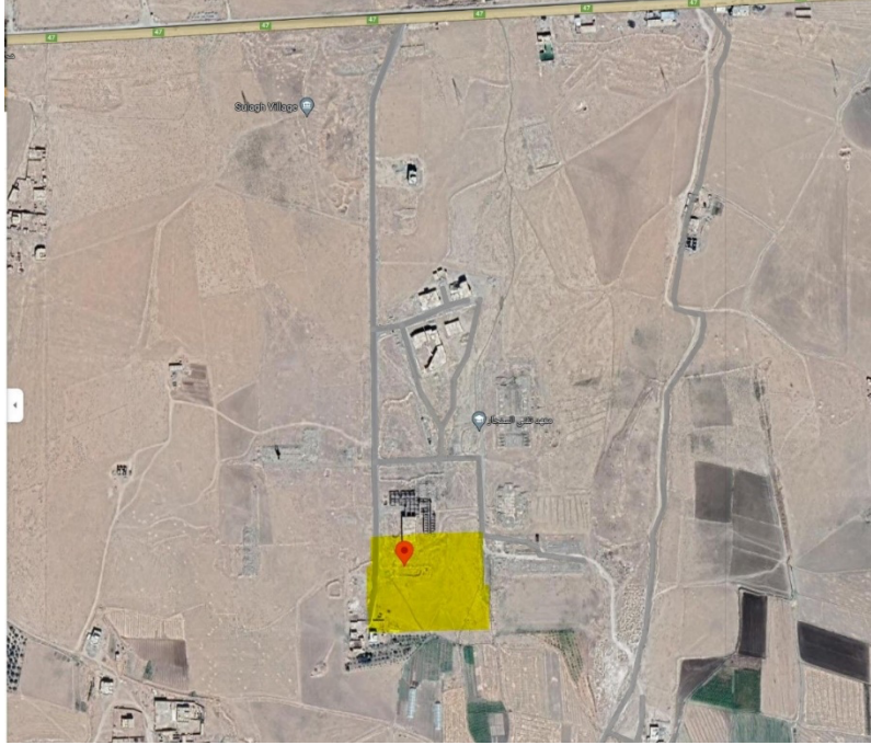
وینہی سہ تہ لایت: ئەم وینہیہ شوینی بیرگە کہ نیشان دەدات و وریگای شنگال و تە لە عەفر (٤٧) بێشان دەدات