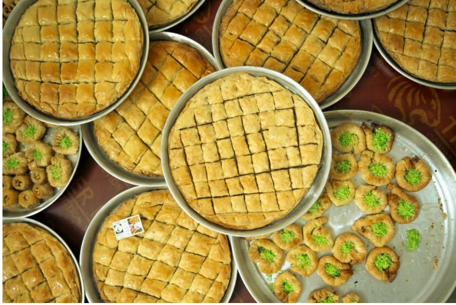
وئنه‌ی دوکانی شیرینی زیکرا: سه‌عد مهربوانی @ IOM ۲۰۲۴

هه‌روه‌ها ده‌کرت گه‌شه‌پێدان و بوژانه‌وه‌ی ئابوری له ئاستیکی به‌رزتردا چاره‌سه‌ر بکرت به پالپشتیکردن له فراوانکردنی کار و بزسه‌ بچووک و مامناوه‌نده‌کان (SMEs).